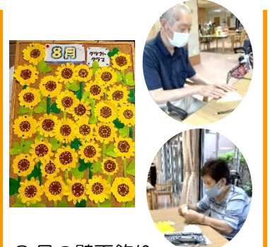
8月の壁面飾り 「ひまわり」作り