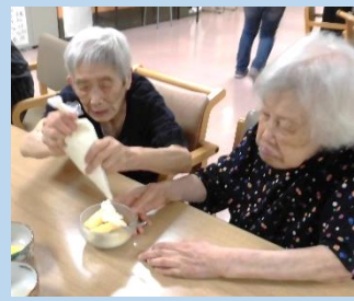
息の合った協力体制